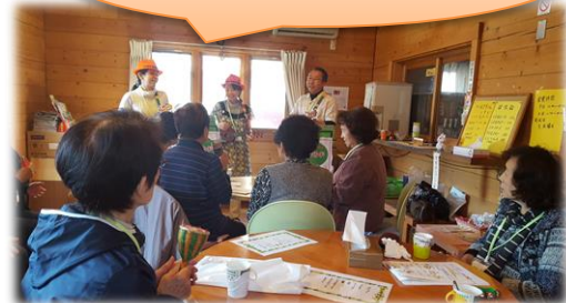
カフェの様子です♪