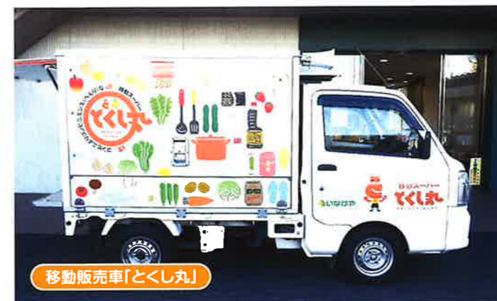
移動販売車「とくし丸」

無料送迎の実施と、移動販売車「とくし丸」を誘致し「スーパーいなげや」の生活用品や食品食材の購入支援を実施しております。